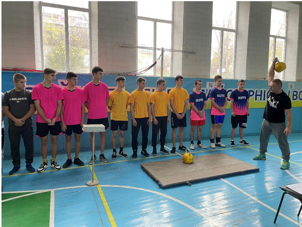
Команда юнаків на змаганнях з гирьового спорту