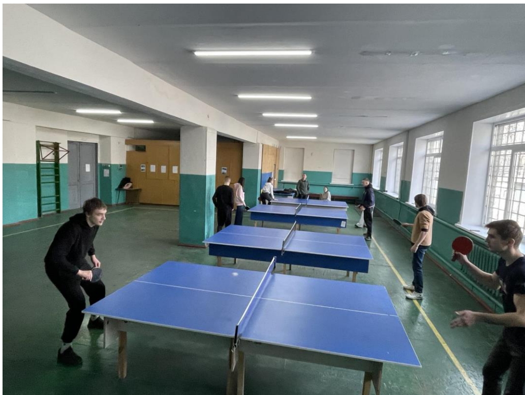
Команда дівчат та юнаків з настільного тенісу