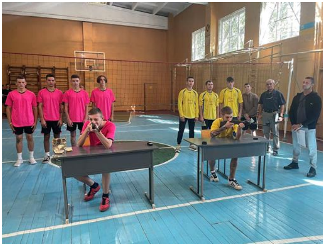
Команда юнаків на змаганнях з допризовної підготовки