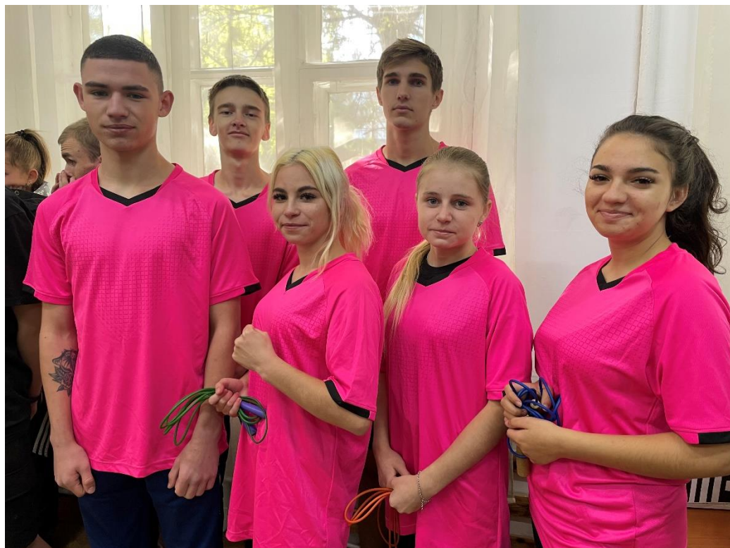
Команда юнаків та дівчат з гімнастичного триборства